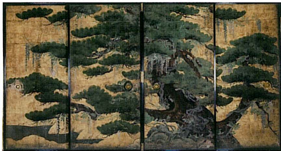
西山別院寺宝 重文 襖絵四面『松に藤』①