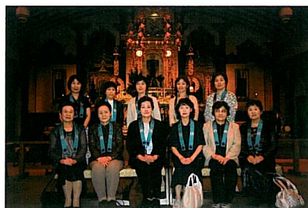
神戸別院本堂で記念撮影

西山別院と趣きが 違い驚きました。 また花鳥園では、 きれいな花と鳥た ちに囲まれて、久 しぶりにゆったり とした時間を過 せました」と。