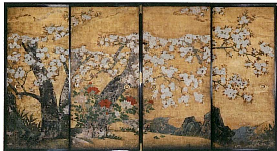
西山別院寺宝 重文 襖絵四面『桜に牡丹』

ら2010年にかけて に、全国を 巡回予定。 詳細は別 院寺務所ま でお問い合 わせくださ い。