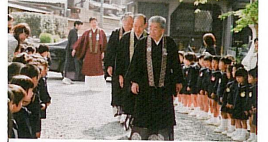
ご門主様到着時には西山幼稚園の園児が元気よくお出迎え