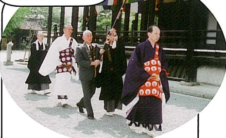
法要に先立って、別院北側にある覚如上人ご廟所へと、お付の方を伴われて、ご焼香に向かわれました