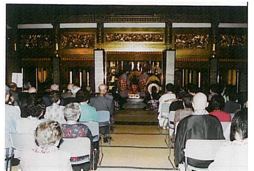
本堂は140名以上の参拝者で満堂に!!