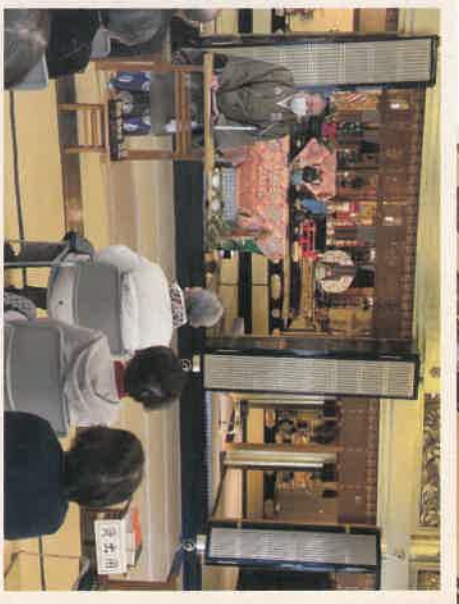
長屋輪番のご挨拶