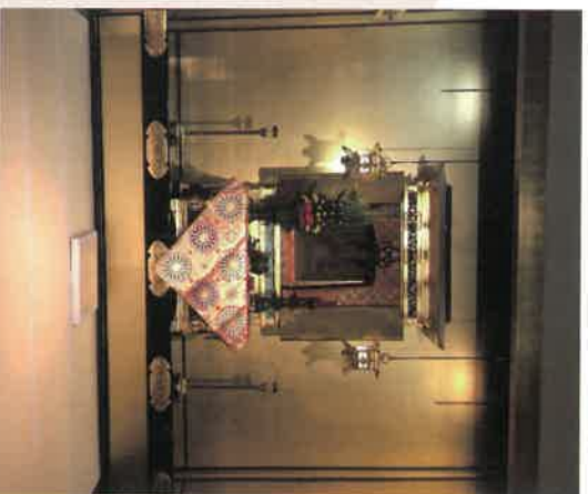
覚如上人御影 (西山別院本堂左余間)