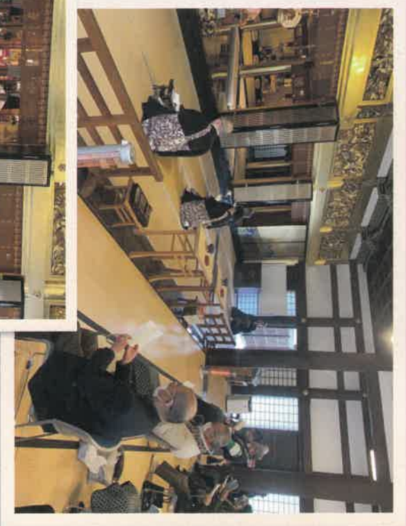
仏説阿彌陀経を勤行

新型コロナウイルス(COVID-19)による感染拡大の状況を踏まえ、境内に消毒用アルコールの設置、一部職員のマスク装着、参拝席の間隔を従来より広とする、法要時間の短縮など、参拝者並びに別院職員の健康と安全を第一に法要をこめさせていただきます。