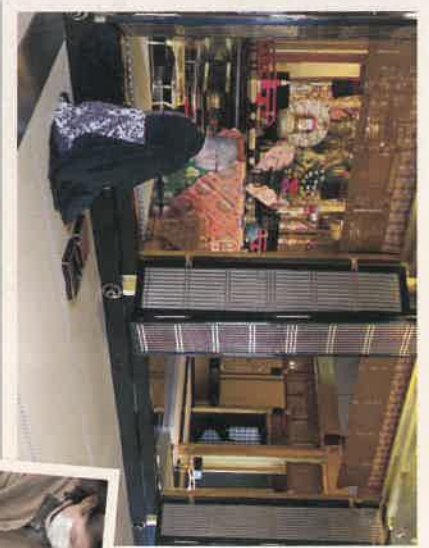
「信心獲得亭」御文章拝読