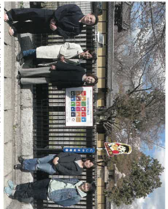
ぎんなん会(西山幼稚園卒園児保護者会)の皆さんも活動に賛同くださっております。

西山別院山門前駐車場入り口付近にSDGsの周知のためSDGsロゴを掲示しました。SDGs活動を地域の皆さんと連携しながら取り組みを推進しています。