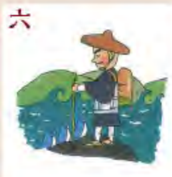
六 承元の法難 流罪となって 越後へ