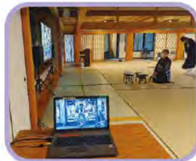
法要の様子を対面所へオンラインで中継しました。