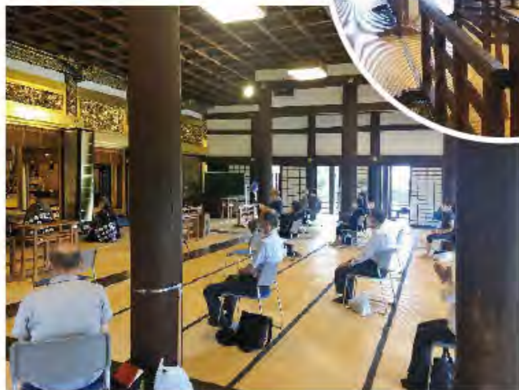
十分な感染予防を行い、密集を避けて法要をお勤めしました。