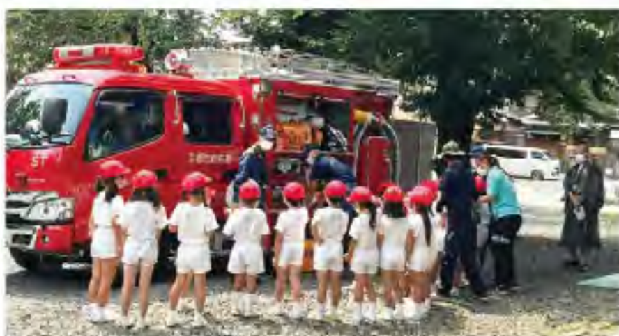
「うわぁ！消防車や！」 園児たちは、消防士さんや消防車に興味津々。