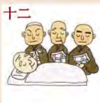
十二 弘長2年11月28日 (新暦1263年1月16日) 善法院(角坊)で ご往生

本年も、十月二十二日、二十三日、西山別院本堂にて「報恩講」が勤まります。 報恩講は、真宗門徒にとって一年の中でもっとも大切な仏事で、西山別院では、ご本山の御正忌報恩講前に「お取り越し」として、お勤めいたします。 一二九四(永仁二)年、親鸞聖人三十三回忌の際に、曾孫にあたる本願寺第三代覚如上人(西山別院開基)が、ご自身の著作「報恩講私記」で、聖人への深い謝意を表明されたことから、それ以降、親鸞聖人が伝えてくださった教えに遇い、依りどころを教へていただいた御恩に報謝する法要として毎年大切に営むようになりました。 昨年同様にコロナ禍が続いておりますが、参拝者の皆さまの健康と安全を第一に、十分な感染症防止