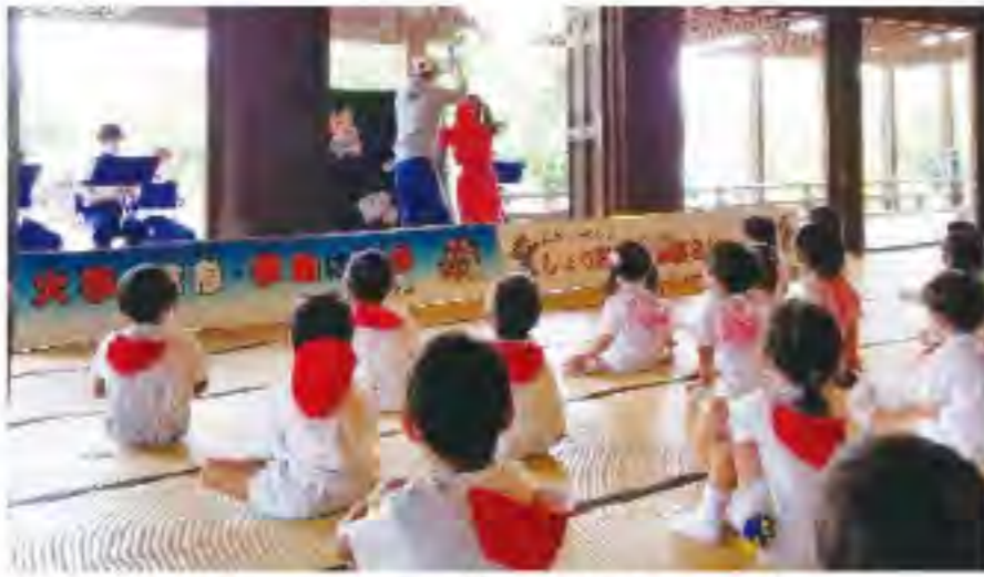
キャラクターショー「ほのおちゃん」 火遊びは絶対してはいけないことを学びました。

夏の文化財防火運動期間中（七月十二日～同十八日）の七月十三日（火曜日）、新型コロナウイルス感染症拡大に留意しながら西京消防署、京都市消防音楽隊、西山幼稚園、西山別院による合同消防訓練を実施しました。訓練は、本願寺西山別院の本堂前付近から出火し、本堂内に重要文化財や逃げ遅れ者がいるとの想定で訓練を行いました。西山幼稚園の園児らは、本堂前での放水訓練を見学し、同日実施の消防音楽隊コンサート（本堂内）と消防車両見学（本堂前白洲）は、三密回避のために二班に分かれて参加しました。参加者全員が貴重な文化財を守り、後世に伝えていく大切さを改めて実感いたしました。