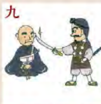
九 山伏弁円の改心