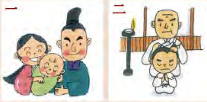
一 承安3年4月1日 (新暦1173年5月21日)天台宗の慈円和尚 京都の日野の里 にて誕生