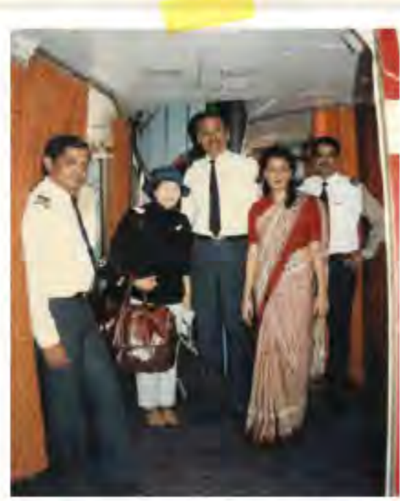
機長とキャビン-アテンダント にお願いして写真を一枚

旅行社の方より、インドでは、時計の観念がなく、太陽と共に行動をするのだという説明が心に残りました。