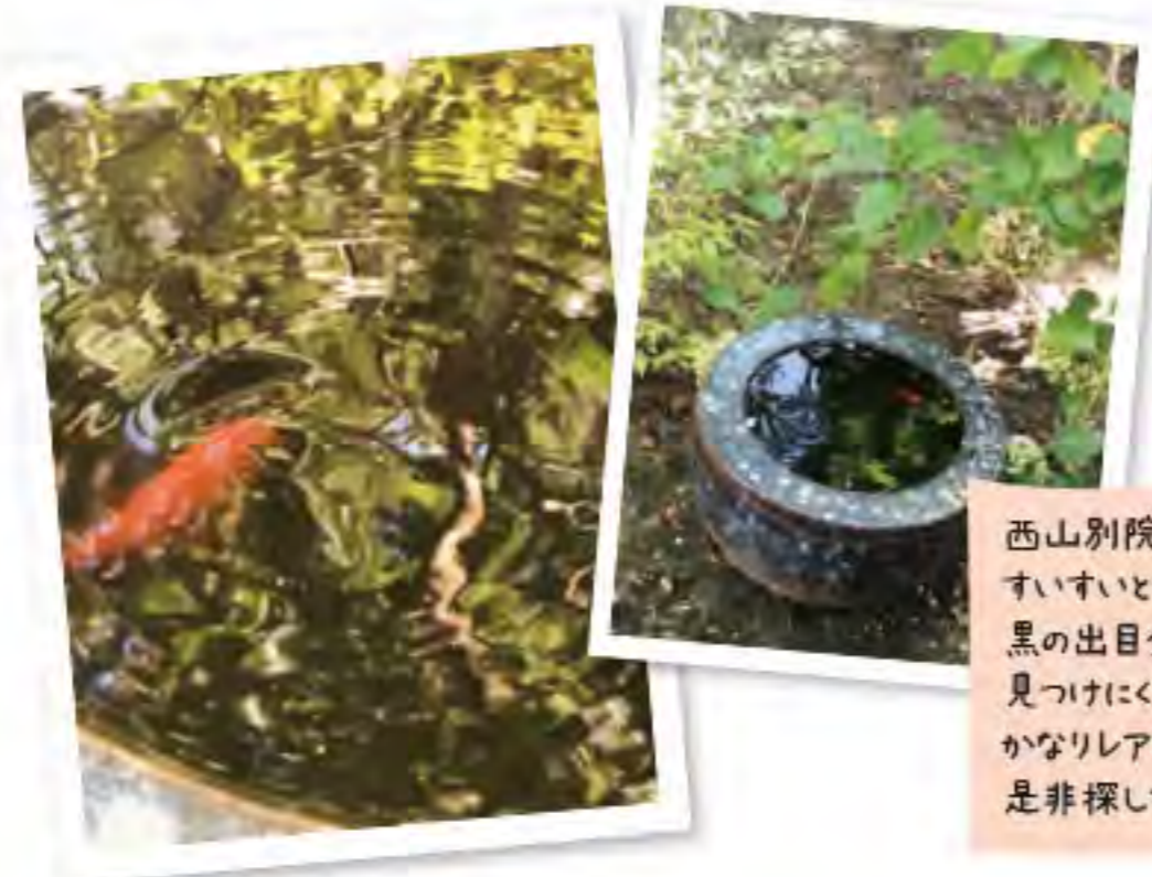
西山別院のアイドル(?)金魚さん すいすいと泳ぐ姿はとても可愛いです。 黒の出目金も7匹いるのですが、 見つけにくいえに恥ずかしがりやなので かなりレアキャラです。 是非探してみてください。