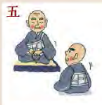
五 専修念仏を説く 法然聖人の 門下に入る