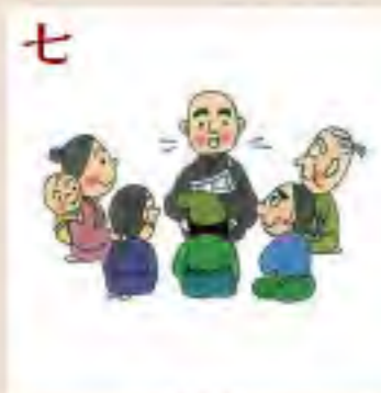
七 越後 在俗のままで 念仏の生活