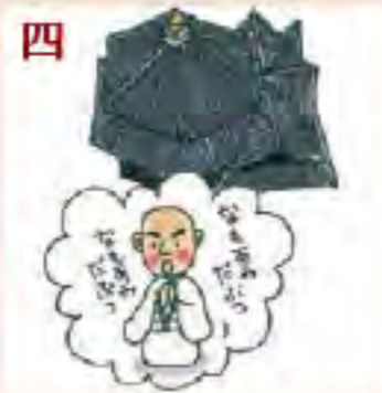
四 京都洛中の 六角堂(頂法寺)を 訪れ、100日間参籠