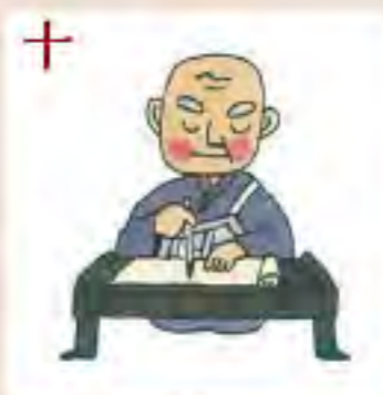
十 関東(稲田の草庵) を拠点に20年間に わたって布教