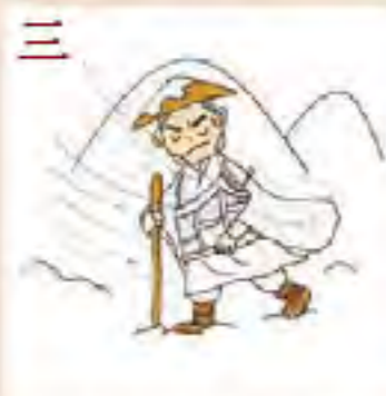
三 20年間に及ぶ 比叡山での修行