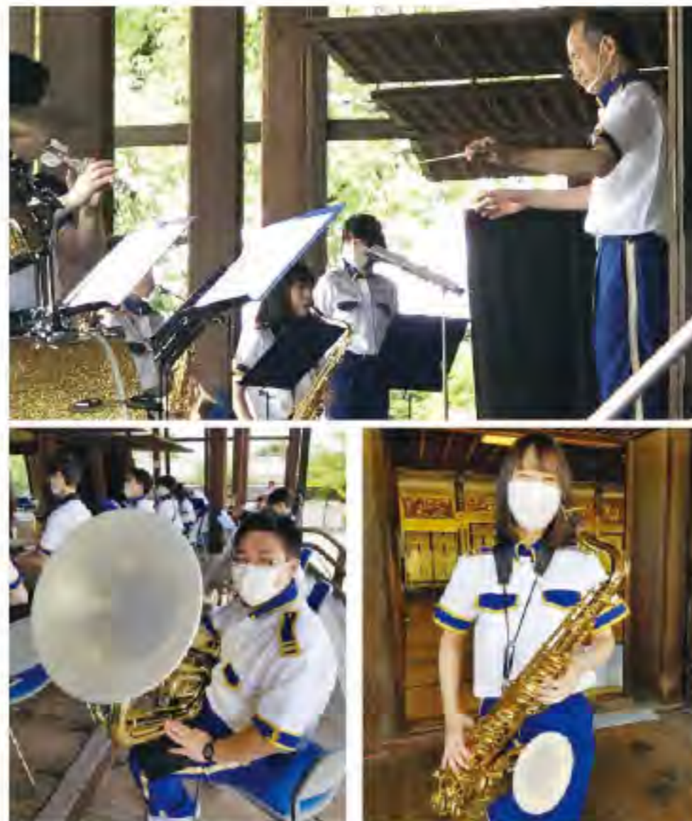
楽器もマスクをしています。

音楽演奏を通じて、市民に対する防火・防災思想の普及啓発を行うことを目的に、昭和三十年十二月に発足。「ひと・まちの『絆』でつくる安心都市・京都」の実現を目指して、市民との「ふれあい」を大切にした防火・防災活動に取り組みられています。