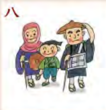
八 常陸への 旅立ち