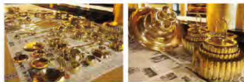
日時:10月18日(月)午前9時~12時 場所:本堂縁側