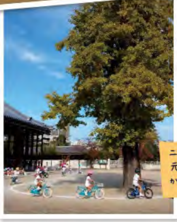
ニコニコ笑顔で元気いっぱいパレードしました。