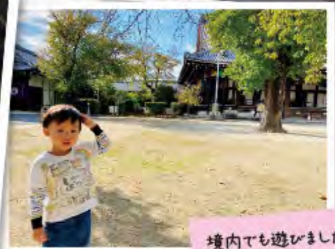
境内でも遊びました♪