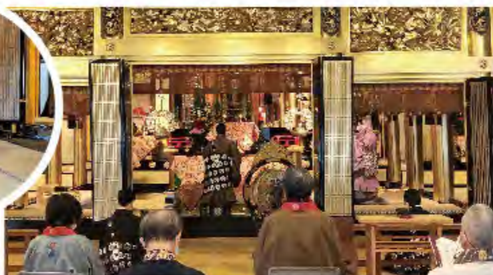
日中法要「正信念仏偈作法・第二種」