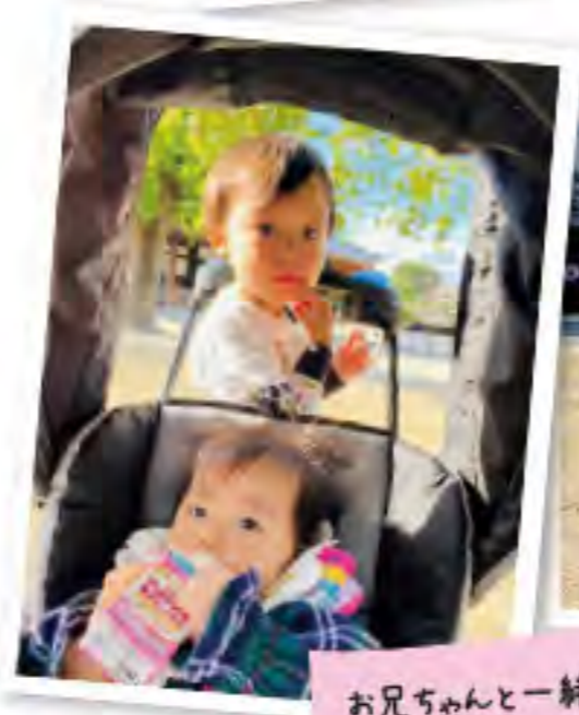
お兄ちゃんと一緒に