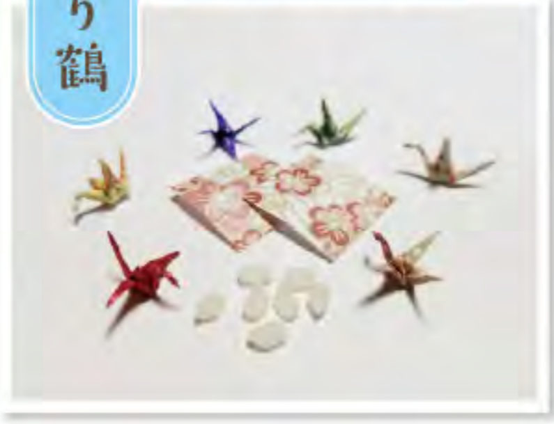
石川県七尾市 富樫さんの作品

西山幼稚園の園児さんからお寺に可愛いメッセージが届きました。「おたのみなさんへ11月18日にちむくようひ10じ45分おしらすでてんしおはれどをします。みにきてください。」