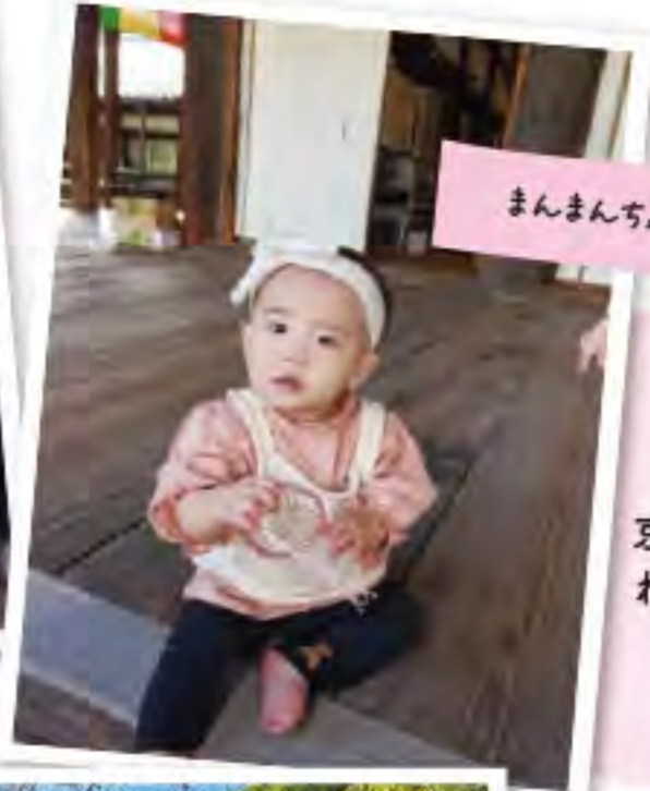
京都市 れんかちゃん